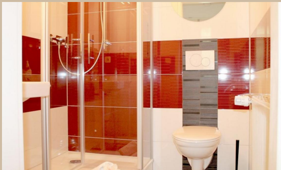
Eismeer 1 ca. 44 m 2 Wohnfläche zzgl. Terrassen ERDGESCHOSS